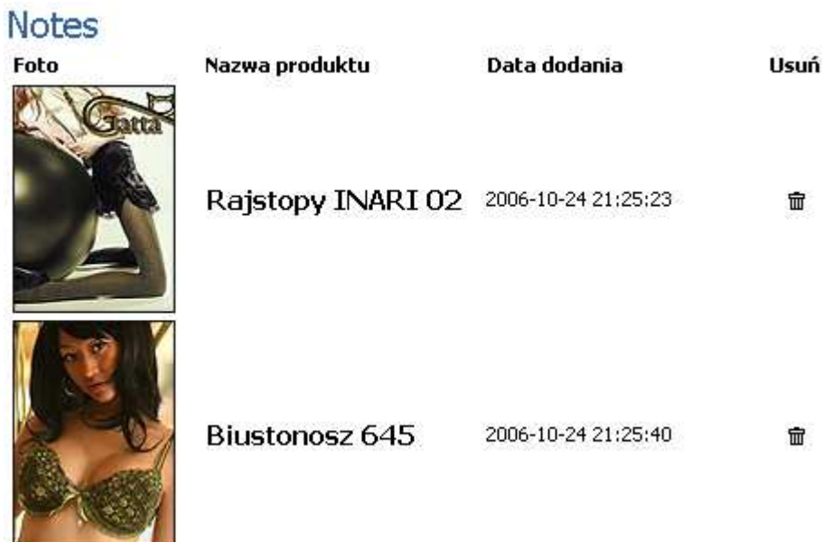
Notes wraz z dodanymi produktami

Notes to funkcja, która umożliwia zebranie wybranych przez nas produktów w jedno miejsce. Aby dodać produkt do notesu na stronie prezentacji produktu kliknijmy na odnośnik „zapisz produkt w swoim notesie”. Do czego służy notes? Jest to świetne miejsce do tego, aby wybrać produkty, które chcemy kupić w przyszłości.